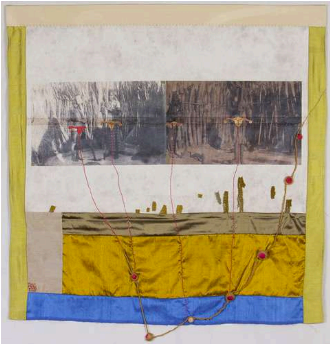
Image : Tuly Mekondjo, "Meekulu tu tula omwenyo / Grandmother revive us" , 2021, collection privée, Londres

8/ "Meekulu tu tula omwenyo / Grandmother revive us" , 2021, Transfert d'images, marqueur d'or sur toile, fil à broder en coton, fil à crochet, tissus en soie, 96 x 95 cm Collection privée, Londres