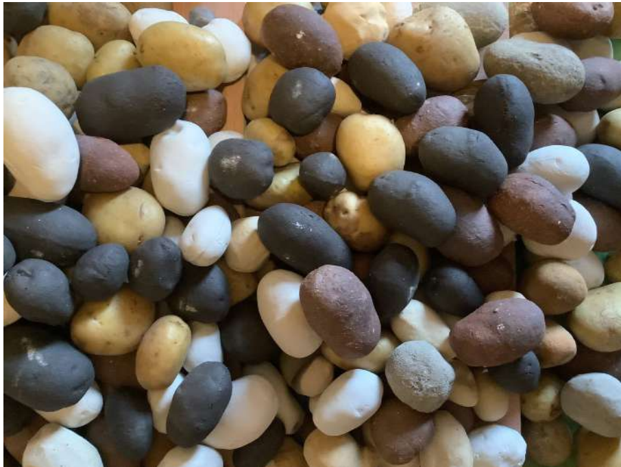
Image : Jean-Paul Thibeu, détail de 'Méta-radeau de la Traverse', 2023