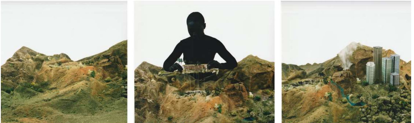
Image : Otobong Nkanga, Etude pour 'Alterscape stories, Uprooting the Past', 2006, collection privée, Londres