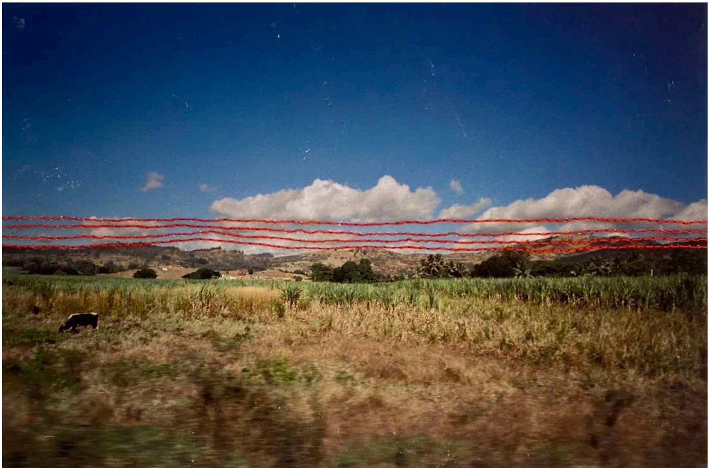
Image: Shivanjani Lal, '4 Lines Across a Horizon – Ba', 2021