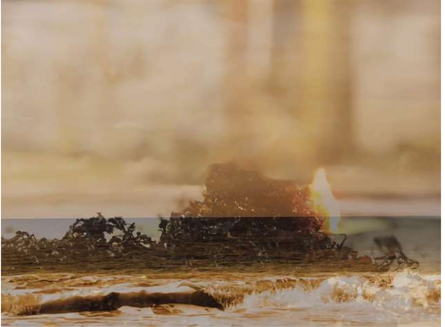
Image: Louisa Marajo 'J'ai traversé la Mer' , 2022, vidéo en boucle