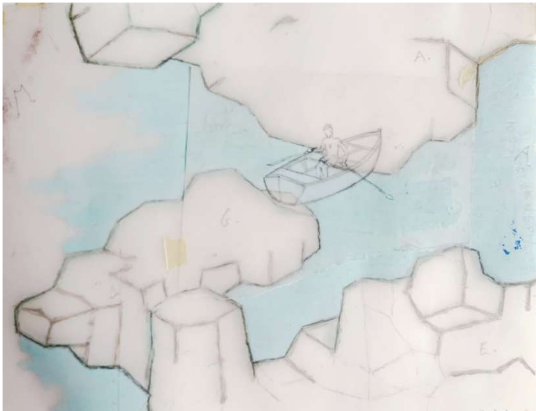
Image: Francis Alÿs, 'Untitled', 2007, Collection privée, Saint-Ouen.